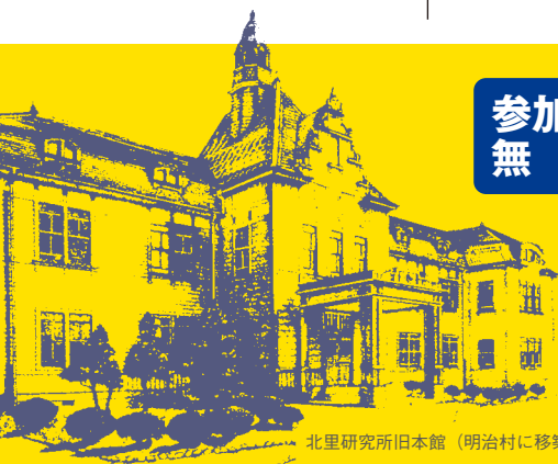
北里研究所旧本館 (明治村に移築保存)