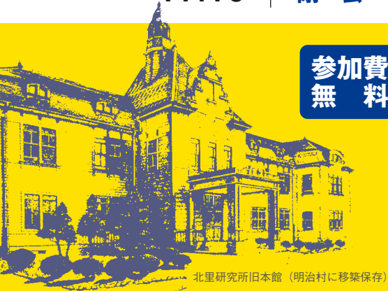
北里研究所旧本館 (明治村に移築保存)