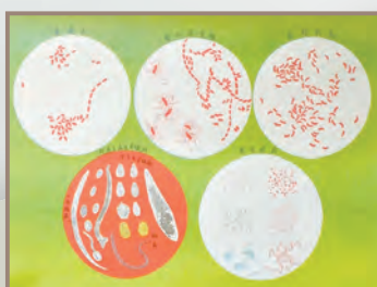
「飲料水とその改善図解 第五不良水中の細菌類」より 1915年頃：北島多一、田村瑞穂