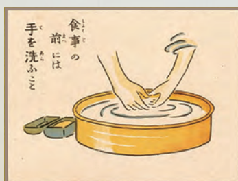
「結核退治絵解」より 1913年：北里柴三郎、佐伯矩