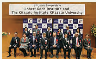
2018年、相模原キャンパスで開催された合同シンポジウムの参加者

In October 1988, the then Federal Minister of Health of Germany visited us to offer the revival of active interchanges between the Koch Institute and The Kitasato Institute. Subsequently both parties discussed and agreed to hold a joint symposium every two years in Berlin and Tokyo alternatively. The first milestone joint symposium was held in August 1990 in Berlin, followed by the conclusion of an academic exchange agreement in 2008. This symposium has been held 15 times until 2018, and served as a forerunner of international academic exchanges in Japan.