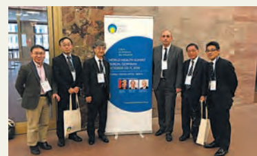
2016年、ベルリンで開催された合同シンポジウムの北里側参加者

Participants in the 2018 joint symposium on Sagami-hara Campus