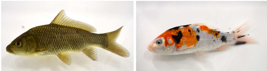
【画像1】 マゴイ（左）と大正三色（右）