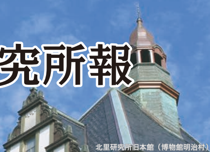
北里研究所旧本館（博物館明治村）