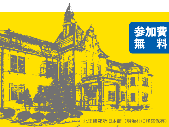
北里研究所旧本館 (明治村に移築保存)