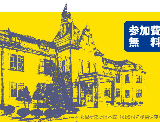
北里研究所旧本館 (明治村に移築保存)